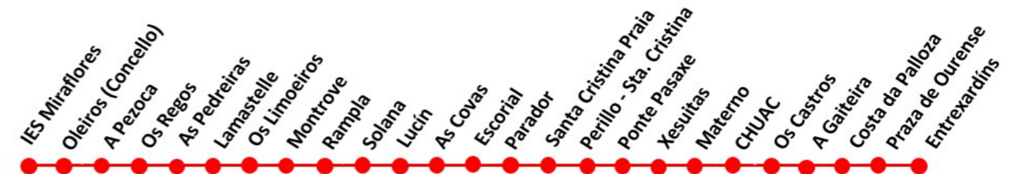
Línea > A Barcala - A Barcala (circular por O Burgo)